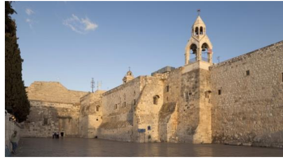
Abbildung 18: Die Geburtskirche in Bethlehem

In Bethlehem verschanzten sich Anfang April 2002 mehr als 150 Palästinenser in der Geburtskirche. In dieser Kirche wurde nach christlicher Überlieferung Jesus geboren. Die Palästinenser waren auf der Flucht vor israelischen Truppen, die in der Stadt nach den Hintermännern der zahlreichen Anschläge suchten, die im März in Israel verübt worden waren. Kurze Zeit später rückten israelische Panzer in die Stadt ein und die Armee verhängte eine Ausgangssperre von 39 Tagen über Bethlehem.