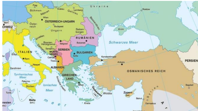
Abbildung 1: Das Osmanische Reich

Der erste Weltkrieg veränderte die Situation im Nahen Osten grundlegend. Das Osmanische Reich kämpfte auf der Seite des Deutschen Kaiserreiches und Österreich-Ungarn. Nach dem Ende des Krieges zerfiel das Großreich. Großbritannien besetzte schon im Jahr 1917 Jerusalem und im folgenden Jahr erlangte es die gesamte Kontrolle über