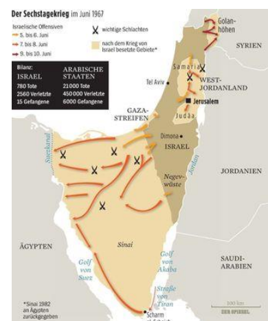
Abbildung 7: Verlauf der Suezkrise

Die USA wollten sich nicht mit einem Alleingang ihrer Verbündeten abfinden. Der diplomatische Druck wurde verstärkt.