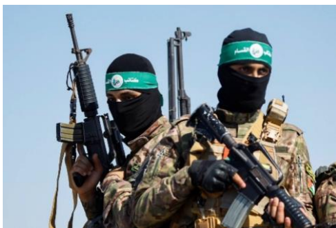
Abbildung 21: Zum Gedenken an die siegreichen Schlachten, die Mohammed als Feldherr geschlagen hat, tragen die Kämpfer der Hamas grüne Stirnbänder

Die Hamas veröffentlichte ihre Charta mit Zielen und Prinzipien ein Jahr nach ihrer Gründung 1987. Demnach ist das Hauptziel der Hamas die Zerstörung Israels durch den „Heiligen Islamischen Krieg“ und die Errichtung eines Islamstaates „Palästina“.