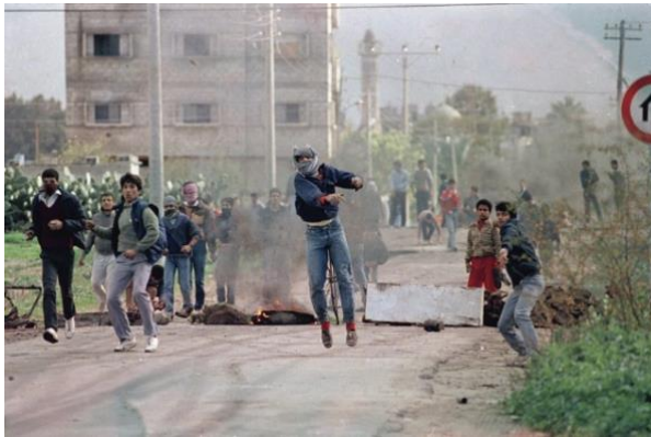
Abbildung 12: Gewaltsame Proteste in Nablus, es sind auch junge Menschen dabei

Der Aufstand breitete sich rasch aus. Der wirtschaftliche Boykott war eines der wirksamsten Mittel, um gegen die israelische Besatzung zu protestieren. Die Palästinenser wurden aufgefordert, keine israelischen Produkte mehr zu kaufen. Außerdem verweigerten