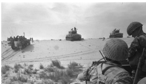
Abbildung 8: israelische Truppen rücken gegen die ägyptische in Gaza vor

Im Mai 1967 feiert der Staat Israel seinen 19. Geburtstag. Aber auch die israelische Regierung war sich der Gefahr für die Existenz ihres Staates bewusst: Der ägyptische Präsident Nasser fand für seine Hasstiraden gegen den jüdischen Nachbarn Israel Beifall bei den Arabern. In der ägyptischen Hauptstadt Kairo herrschte Kriegsstimmung. Nasser schmiedet eine Anti-Israel-Koalition mit Jordanien, Syrien, dem Libanon und dem Irak. Auf Druck Ägyptens zogen sich die nach der Suezkrise im Sinai stationierten UN-Truppen zurück. Im Gegenzug nahmen nun ägyptische Truppen die verlassenen Stellungen wieder ein. Nasser fühlt sich unbesiegbar, die ganze Welt war der Meinung, dass er bereits gewonnen hat.