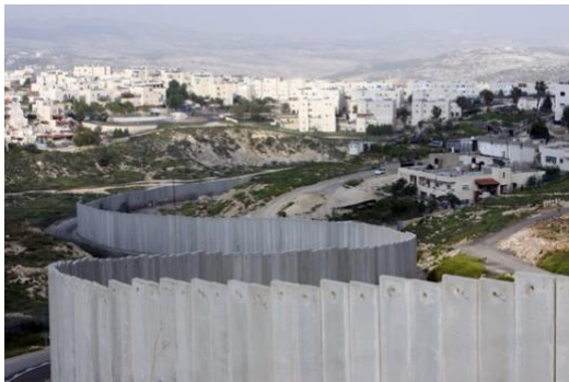
Abbildung 19: Die Sperranlage zwischen Israel und dem Westjordanland

Der Konflikt um die Geburtskirche in Bethlehem wurde nach mehrmaligem Scheitern mit einem Kompromiss beigelegt: Einige Palästinenser gingen ins Exil, einige mussten in palästinensische Gefängnisse, die Mehrheit durfte ohne Strafe in den Palästinensergebieten bleiben. Die Militäraktionen in Dschenin und Bethlehem beeindruckten die radikalen Palästinensergruppen nicht.