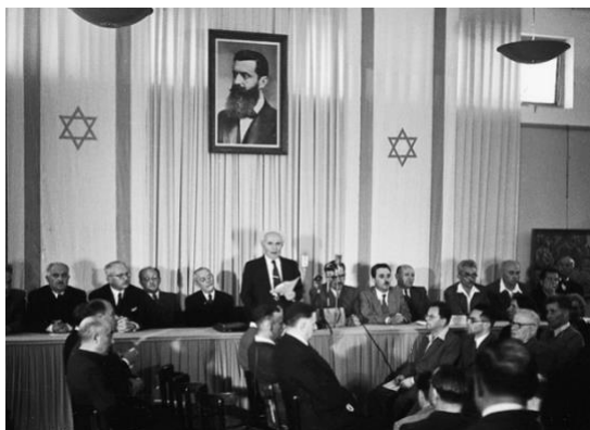
Abbildung 3: Die Staatsgründung Israels unter David Ben Gurion

Die UNO setzte einen Sonderausschuss ein, der im Mai 1947 zum ersten Mal zusammentrat. Am 29. November 1947 verabschiedete die UN-Generalversammlung einen Teilungsplan für Palästina. Das Ziel war, sowohl einen palästinischen als auch einen jüdischen Staat aufzubauen. Jerusalem sollte als corpus separatum behandelt und den Vereinten Nationen unterstellt werden. Im Teilungsplan wurde ebenfalls festgelegt, dass das britische Mandat für Palästina spätestens am 1. August 1948 enden sollte.