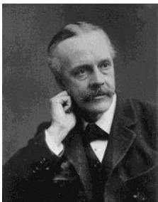
Abbildung 4: Arthur James Balfour

Im Sommer 1917, zur Zeit des Ersten Weltkrieges, zeichnete sich ab, dass die Türkei den Orient verlieren würde. Neue Landkarten wurden von den Siegermächten gezeichnet. Interessengebiete und neue Staaten entstanden, und für die Juden gab es auch eine Idee. Nämlich die "Balfour-Deklaration". Sie war eine politische Erklärung der britischen Regierung, benannt nach dem britischen Außenminister Arthur James Balfour. Am 2. November 1917 überreichte Lord Balfour dem Jüdischen Weltkongress ein offizielles Dokument der damaligen Weltmacht. 5