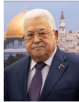
Abbildung 23: Mahmud Abbas

Nach den Friedensverhandlungen zwischen der PLO und Israel ernannte Jassir Arafat seinen langjährigen Vertrauten Mahmud Abbas zum Ministerpräsidenten der Palästinensischen Autonomiegebiete; als Arafat 2004 starb, übernahm Abbas auch die Führung der PLO. Mahmud Abbas ist bis heute Vorsitzender der Fatah und hat wie sein Vorgänger Arafat der Gruppierung zu breiter internationaler Anerkennung auf der politischen Bühne verholfen. Auch der Waffenstillstand zwischen den Palästinensern und Israel, der 2005 zwischen Ariel Sharon und Abbas geschlossen wurde und das Ende der zweiten Intifada besiegelte, fiel in seine Zeit als Parteivorsitzender. Die Fatah war direkt an der zweiten Intifada beteiligt, die durch gewalttätige Demonstrationen anlässlich eines Besuchs von Ariel Sharon auf dem Tempelberg in Jerusalem ausgelöst worden war. Als bewaffneter Arm der Fatah gingen aus ihr die Al-Aqsa-Märtyrerbrigaden hervor. Nach Arafats Tod wurden die Al-Aqsa-Brigaden in Jassir-Arafat-Märtyrerbrigaden umbenannt.