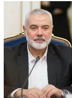
Abbildung 20: Ismail Hanija

Die Hamas entstand als Ableger der islamistischen ägyptischen Muslimbruderschaft kurz nach Beginn der ersten Intifada. Ihr Mitbegründer Scheich Ahmdad Yasin war bis zum Jahr 2004 der geistige Führer der Hamas. Abd al-Aziz ar-Rantisi übernahm nach dessen Tod durch eine israelische Rakete am 22. März 2004 die Führung der Organisation. Bei einem israelischen Angriff knapp einen Monat später kam jedoch auch er ums Leben. Seit diesem Zeitpunkt verfügt die Hamas nicht mehr über einen alleinigen Führer. Als wichtigste Führungspersönlichkeit gilt heute Ismail Hanija, der die Hamas vom Emirat Katar aus vertritt.