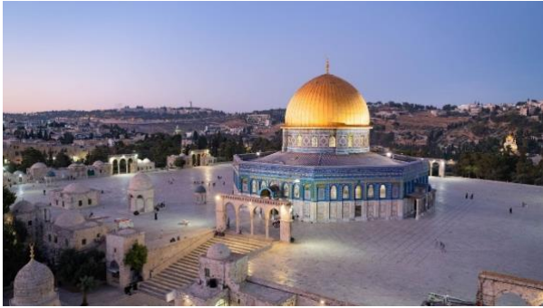
Abbildung 17: Der Tempelberg in Jerusalem

https://static.nationalgeographic.de/files/styles/imaag_3200/public/nationalgeographic28_066061.jpg?w=1600&h=900