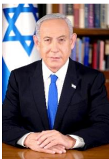
Abbildung 15: Benjamin Netanjahu

Die israelische Armee verhängte Ausgangssperren über die palästinensischen Gebiete, so dass es den Palästinensern in einigen Städten nur noch zu bestimmten Zeiten erlaubt war, ihre Häuser zu verlassen. Gleichzeitig errichteten Soldaten Straßensperren und Checkpoints,