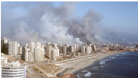
Abbildung 11: Die libanesische Hauptstadt Beirut

In den ersten Jahren, die auf den arabisch-israelischen Krieg von 1948 folgten, blieb es an der israelischen Grenze zum Libanon, verglichen mit anderen, ruhig. Nach dem Kairoer Abkommen von 1969, das der Palästinensischen Befreiungsorganisation (Palestine Liberation Organisation, PLO) die Möglichkeit gab, ungehindert im Südlibanon zu operieren, einem Gebiet, das als „Fatah Land“ bekannt wurde, änderte sich die Situation. Von dieser Basis aus griff die PLO, insbesondere ihre größte Gruppe, die Fatah, Israel häufig an. Dabei zielten sie häufig auf Städte. Die mangelnde Kontrolle über die palästinensischen Gruppen war einer der Schlüsselfaktoren, die zum Ausbruch des libanesischen Bürgerkriegs geführt haben.