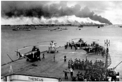
Abbildung 6: britische Truppen vor Port Said

https://www.bpb.de/cache/images/5/236385_original.jpg?CDEED