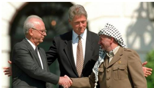
Abbildung 14: Jitzchak Rabin (links), Jassir Arafat (rechts) und Bill Clinton (Mitte)

Jeglicher Ausbau jüdischer Siedlungen in den palästinensischen Gebieten wurde von der neuen Staatsführung untersagt. Im Geheimen trafen sich Vertreter der Regierung mit hochrangigen Vertretern der PLO in Oslo. Nach schwierigen Verhandlungen einigten sich beide Seiten auf einen Kompromiss. Israel sollte sich schrittweise aus den besetzten palästinensischen Gebieten zurückziehen. Im Gegenzug sollten die Gebiete von einer palästinensischen Autonomiebehörde verwaltet werden.