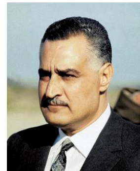
Abbildung 5: Abdel Nasser

Am 26. Juli 1956 verkündet Nasser, den Suezkanal zu verstaatlichen. Die Verstaatlichung des Suez-Kanals war in Ägypten ein Grund zum Feiern. Mit der Verstaatlichung des Suezkanals konnte und wollte sich Großbritannien jedoch nicht abfinden. Auf der einen Seite war der Kanal von großer Bedeutung für die Wirtschaft. Ein Drittel der etwa 15.000 Schiffe, die 1955 den Kanal durchfuhren, waren Eigentum der britischen Krone. Andererseits konnte die britische Führungsschicht nicht akzeptieren, dass ihre ehemalige Kolonie gegen sie opponierte.