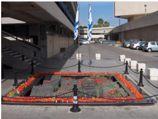
Abbildung 16: Denkmal für Jitzchak Rabin in Tel-Aviv

I have always believed that the majority of the people want peace, are prepared to take risks for peace. And you here, by coming to this rally, along with the many who did not make it here, prove that the people truly want peace and oppose violence. Violence is undermining the very foundations of Israeli democracy. It must be condemned, denounced, and isolated. 23