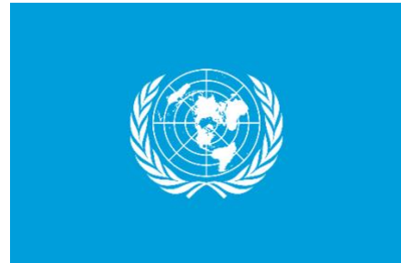
Abbildung 2: Die Vereinten Nationen

Der Zweite Weltkrieg und Hitlers Vernichtungspolitik gegen die Juden veränderte die Haltung der führenden Weltmächte gegenüber der Idee eines eigenen jüdischen Staates. Außerdem forderten die arabische wie auch die jüdische Bevölkerung Palästinas ein Ende des Völkerbundmandats. Sie vertraten dabei aber entgegengesetzte Interessen. Im Februar 1947 bat Großbritannien die neu gegründeten Vereinten Nationen (UNO) um Hilfe. 3