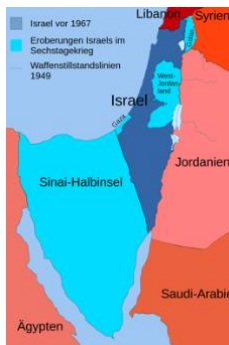
Abbildung 9: Verlauf des Sechstageskrieges

ohne dass eine Kriegserklärung vorlag. Die wenigen ägyptischen Jets, die in der Lage waren zu fliegen, waren nicht lange in der Luft. Das Ergebnis war die Vernichtung der ägyptischen Luftwaffe. Gaza fiel als erste ägyptische Stadt unter israelische Herrschaft. In Kairo wurde der Triumph der eigenen Armee gefeiert, ein Sieg nach dem anderen wurde verkündet. Doch das war gelogen, die ägyptische Armee war geschlagen, Jordanien trat ein. Auch im geteilten Jerusalem herrschte Krieg, Jordanier und Israelis beschossen sich. Israelische Fallschirmjäger eroberten den Ölberg . Dann begann der Sturm auf die Altstadt. Nach mehr als 1900 Jahren war der Tempelbezirk am 6. Juni 1967 wieder in jüdischer Hand. 14